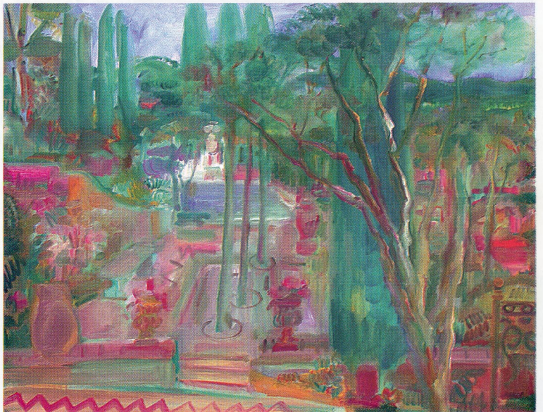
Mon Jardin, 1980, huile sur toile, 14x114 cm