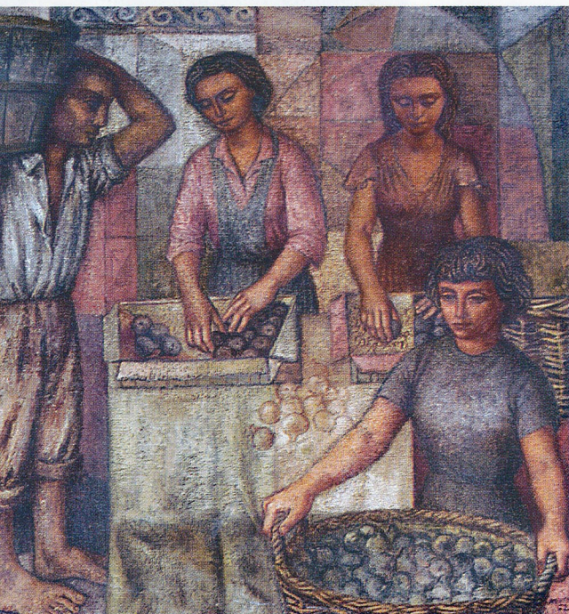
Emballage des figues, 1962, huile sur toile, 120x128 cm

Toucas. A partir de cette date, Mentor commence à bâtir son œuvre où se retrouvent peintures, dessins, pastels et sculptures, sans oublier les grandes compositions qu'il fit pour le siège de l'Unione au Palais Castiglione à Milan ou « la conquête du bonheur » qu'il réalisa sur les murs de la Maison du peuple de la Courneuve à l'instigation du grand critique d'Art et ami Jean Rollin.