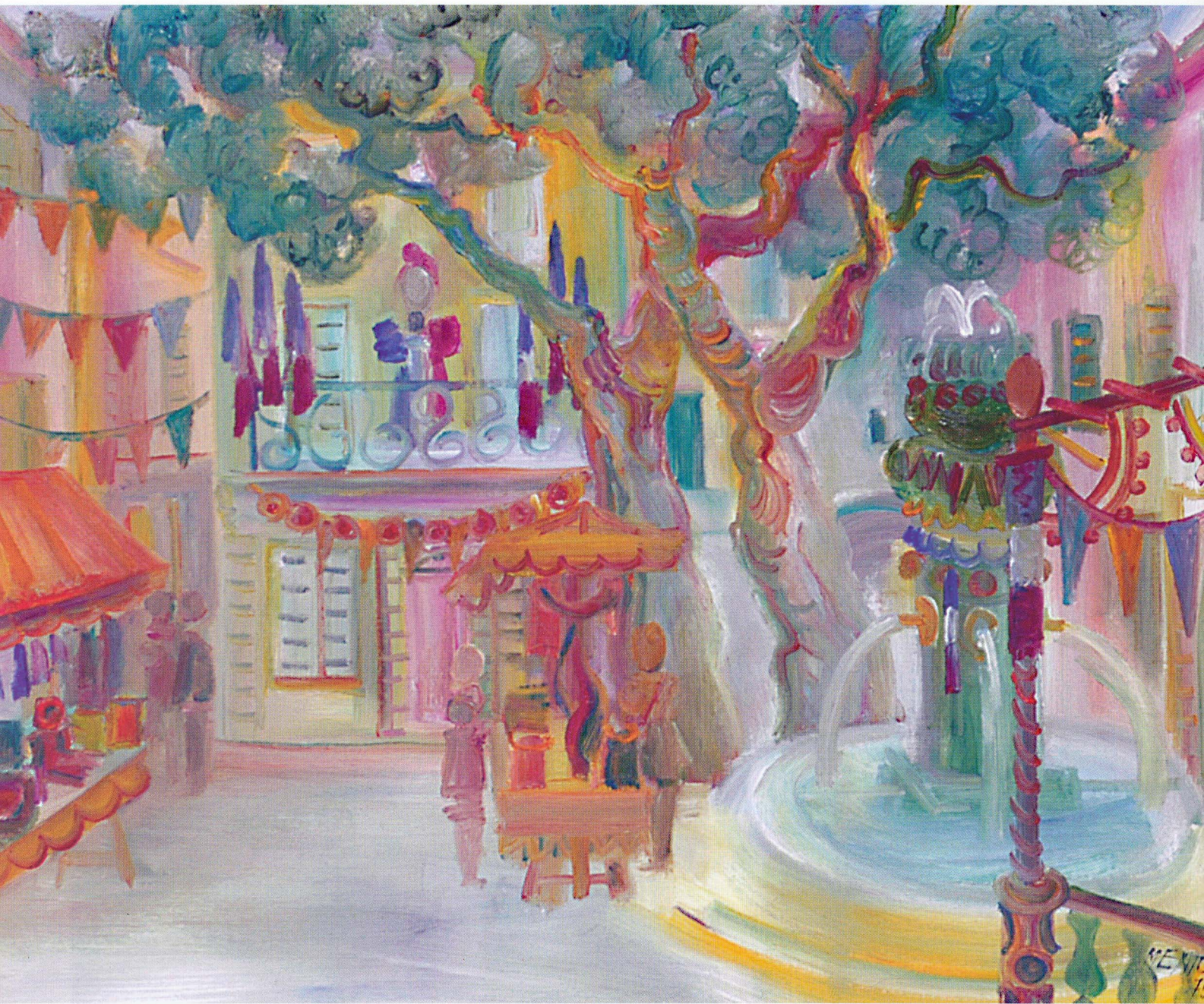
La Fête, 1975, huile sur toile, 60x73 cm