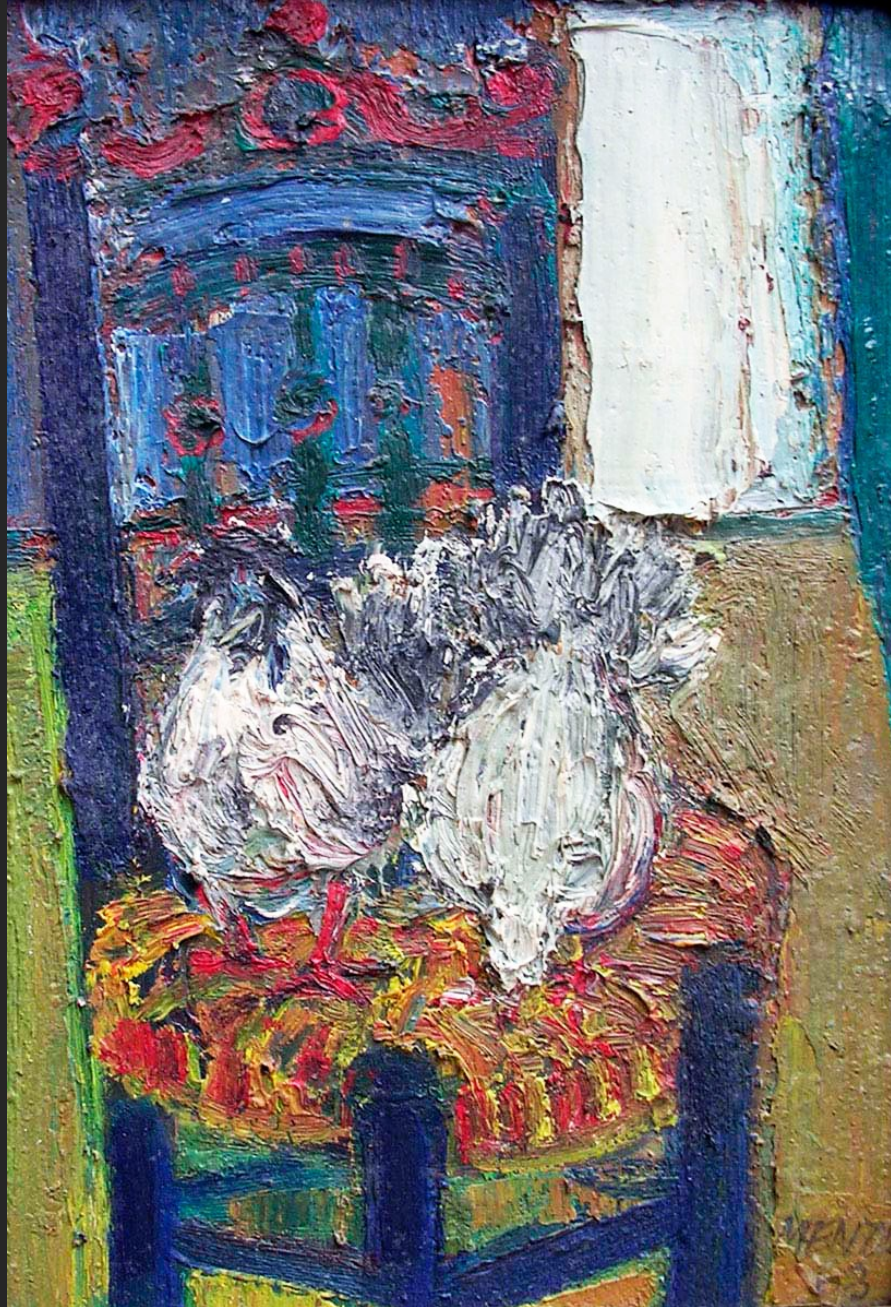
COLOMBES SUR UN FAUTEUIL, 1963, huile sur carton, 27 x 19 cm