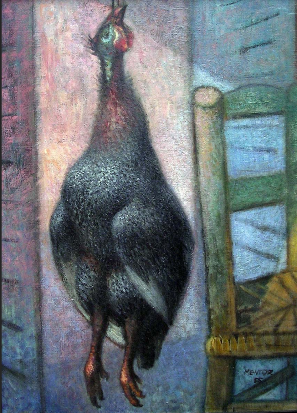
LA PINTADE, 1955, huile sur toile, 73 x 60 cm