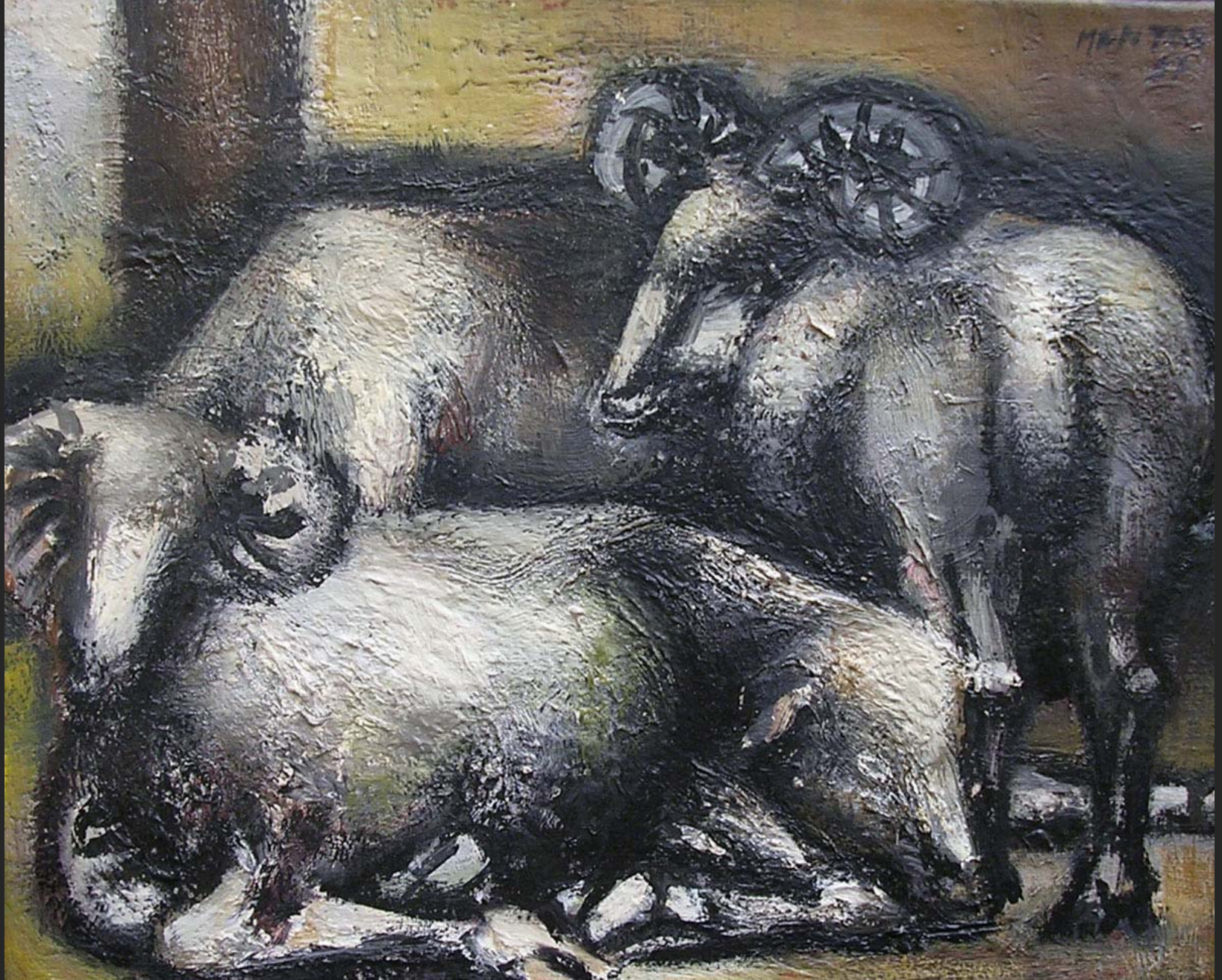
GROUPE DE BÉLIERS, 1957, huile sur toile, 33 x 41 cm