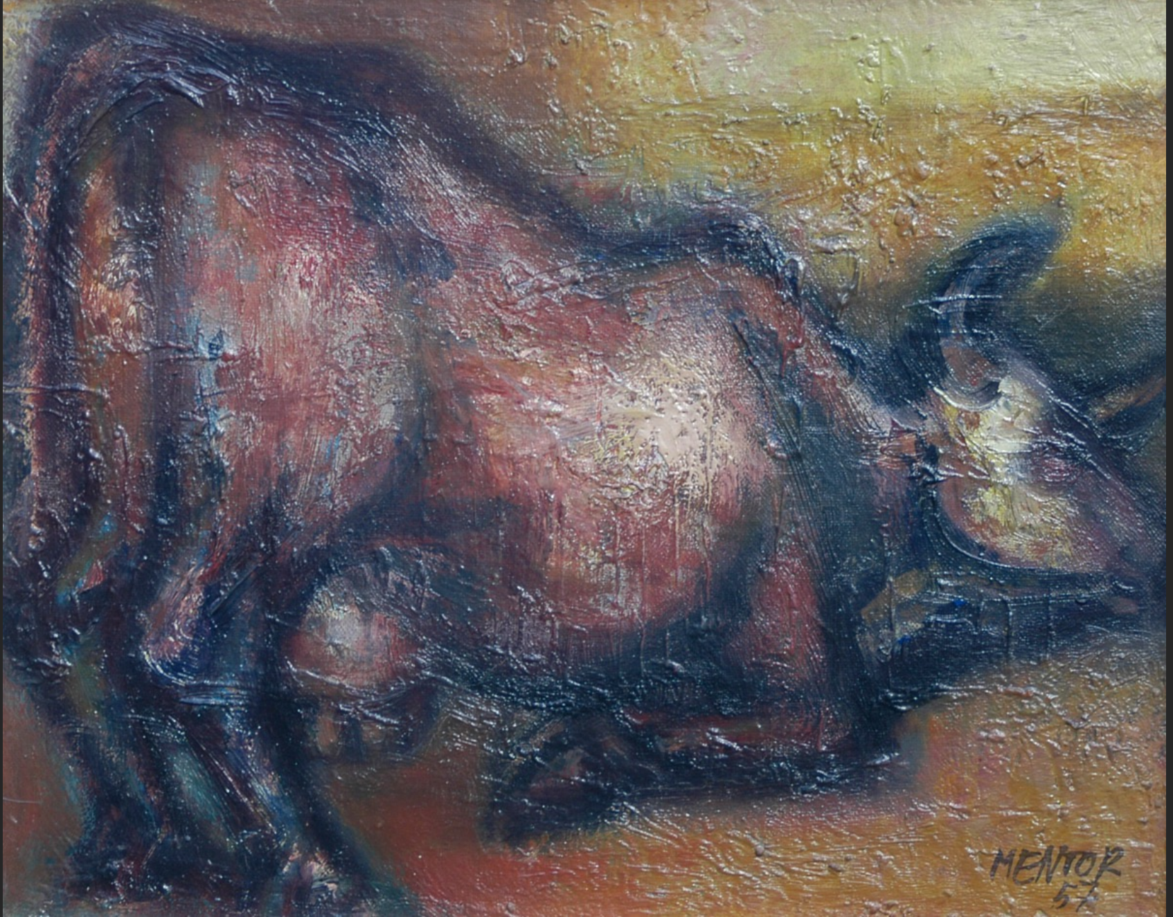
LA VACHE, 1960, huile sur toile, 34 x 41 cm