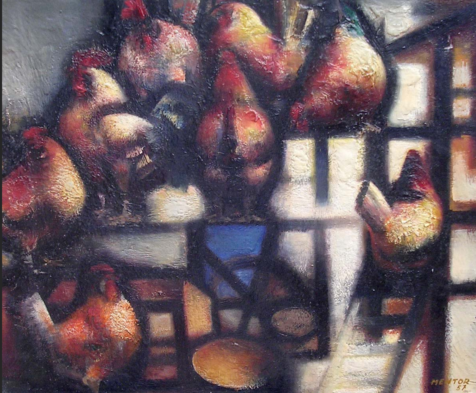
LE POULAILLER, 1957, huile sur toile, 50 x 61 cm