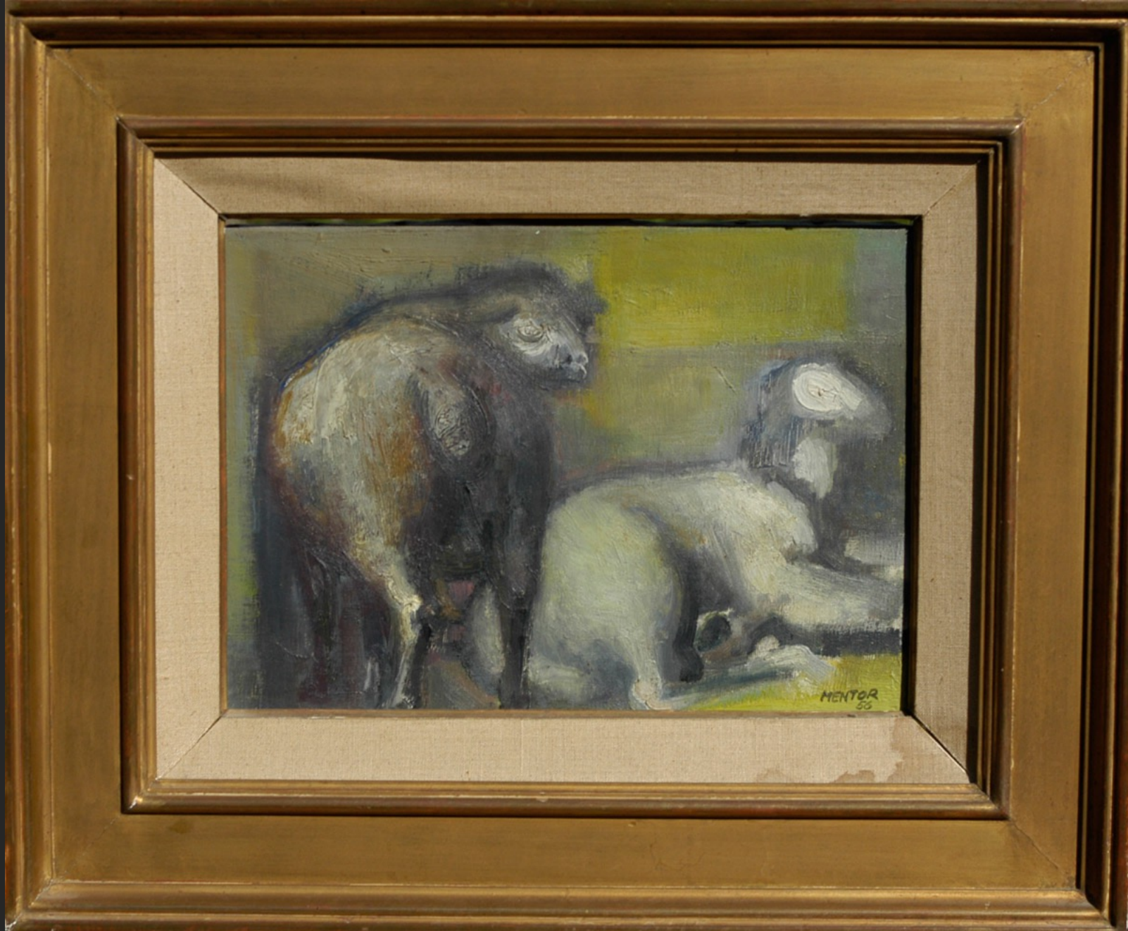
DEUX MOUTONS, 1956, huile sur toile, 24 x 33 cm