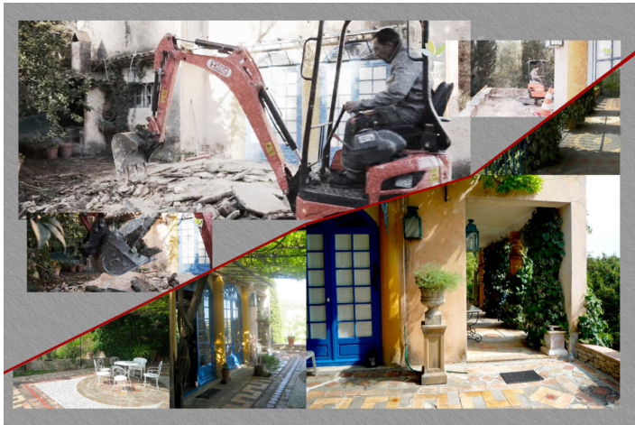
La terrasse de la Casa Nieves, avant et après les travaux.