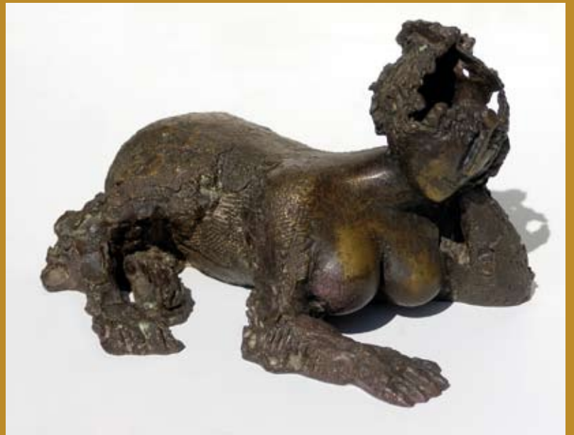
48 - La Sphinge songeuse devant l'énigme , sd