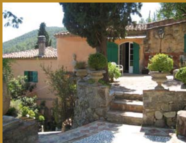
Casa Niéves, maison de Mentor et de Neige à Solliès-Toucas (Var)

Il n'en reste pas moins que cet ensemble, proposé au musée Goya de Castres, représente une leçon de vie et d'espoir. La peinture, la sculpture, quel qu'en soit le sujet, simple, grave, dramatique ou joyeux, nous montrent qu'avec Mentor, la forme, la matière et la couleur sont toujours à la fête.