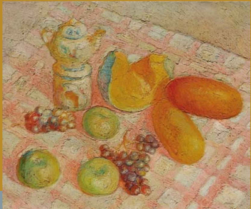
8 - Nature morte à la courge , 1947