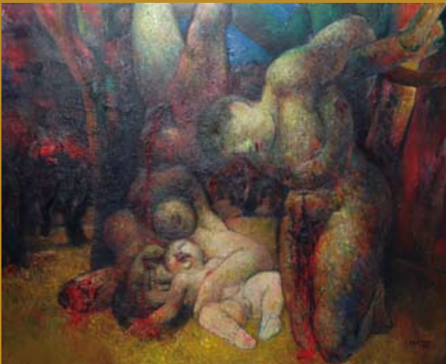
26 - Espagne 39 , 1962