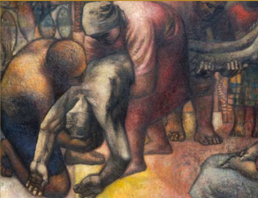
22 - Machado - La mort du poète , 1955