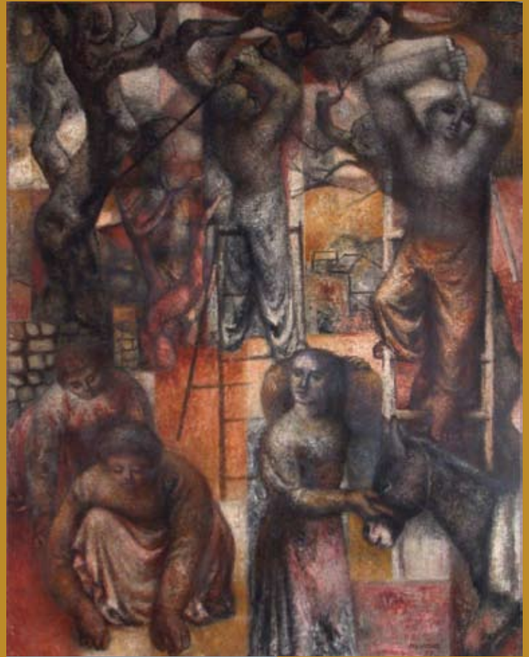
15 - La Cueillette d'olives , 1953