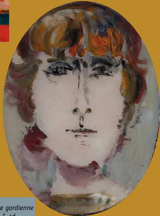
38 - Neige gardienne du Temps I , sd