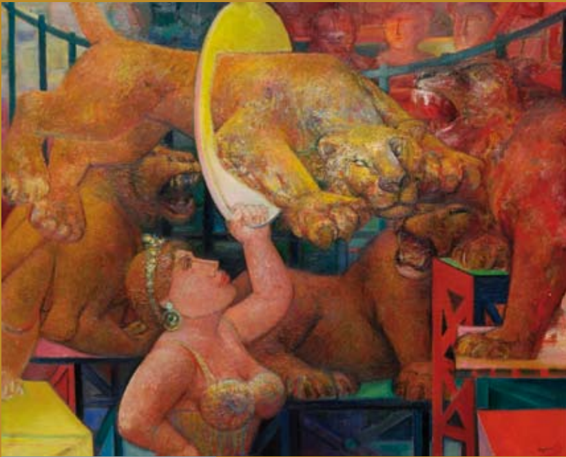
25 - La Dompteuse , 1959