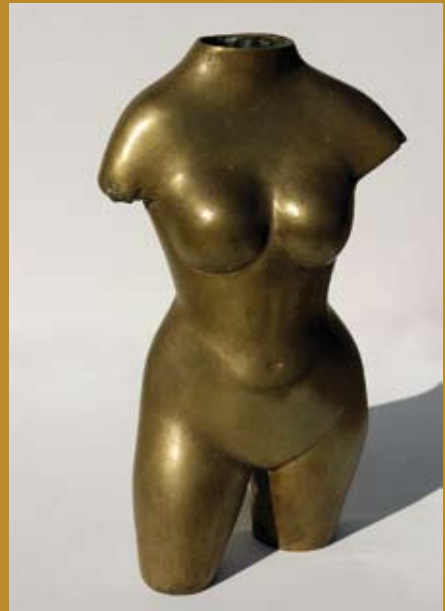
54 - Torse de Vénus Libertina , sd