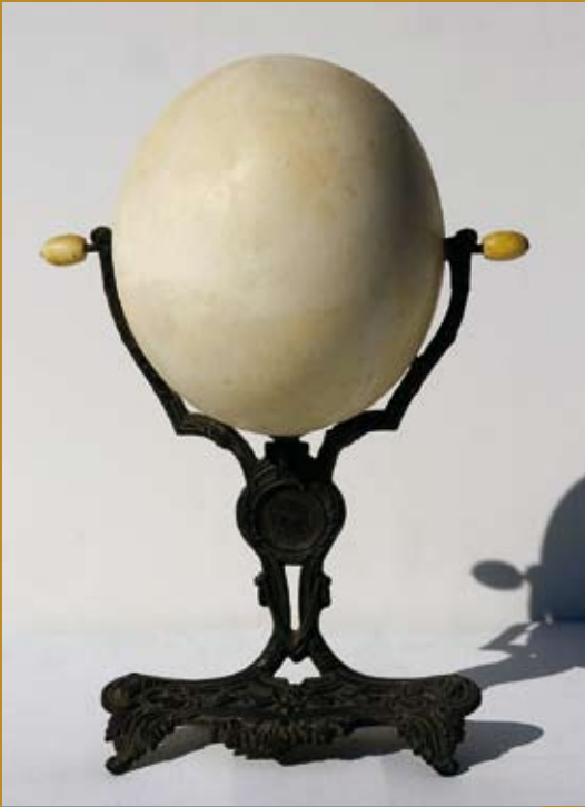
46 - Le Miroir du Temps , assemblage, sd