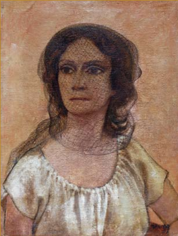
14 - Neige à la violette , 1953