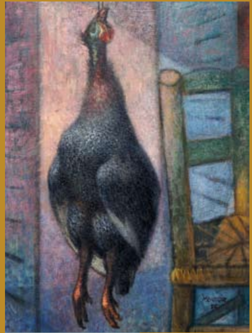
19 - La Pintade , 1955