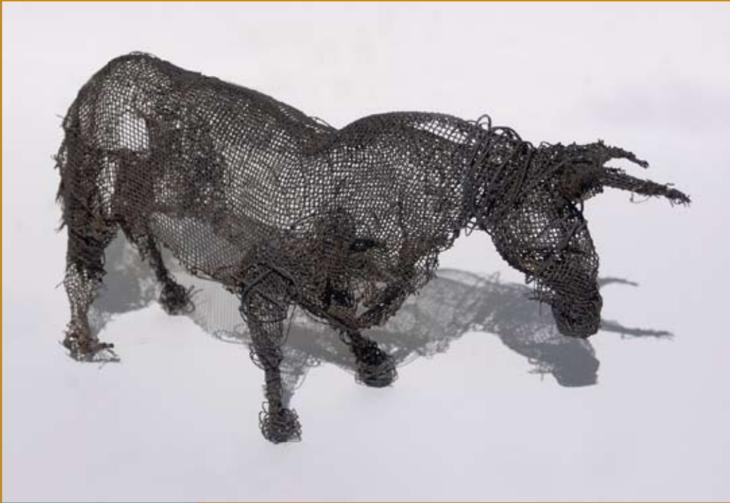
52 - Taureau infini , sd