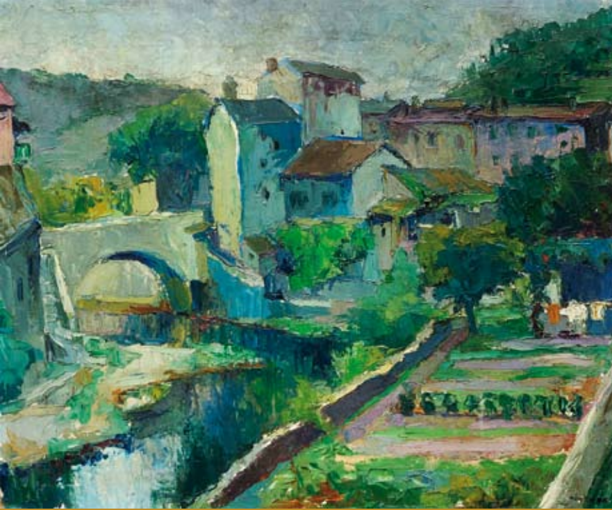
7 - Le Pont , 1946